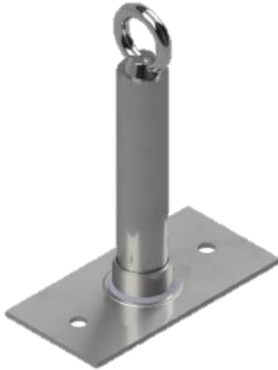
Bild 1: Anschlagereinrichtung, Typ: Primo 2 AD ES BMP Fig. 1: Anchor device, type: Primo 2 AD ES BMP

(12) Ausgabestände dieser Bescheinigung: