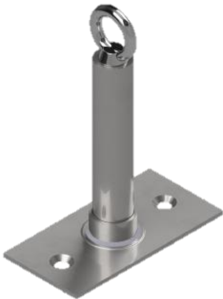
Bild 1: Anschlagereinrichtung, Typ: Primo 2 AD ES-SK BMP Fig. 1: Anchor device, type: Primo 2 AD ES-SK BMP

(12) Ausgabestände dieser Bescheinigung: