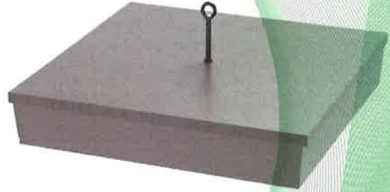
Bilder 1 – 2: Primo 17 AG1