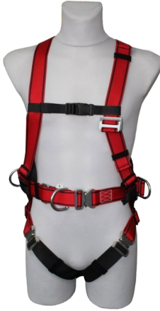
AG 3-S Komfort Klik